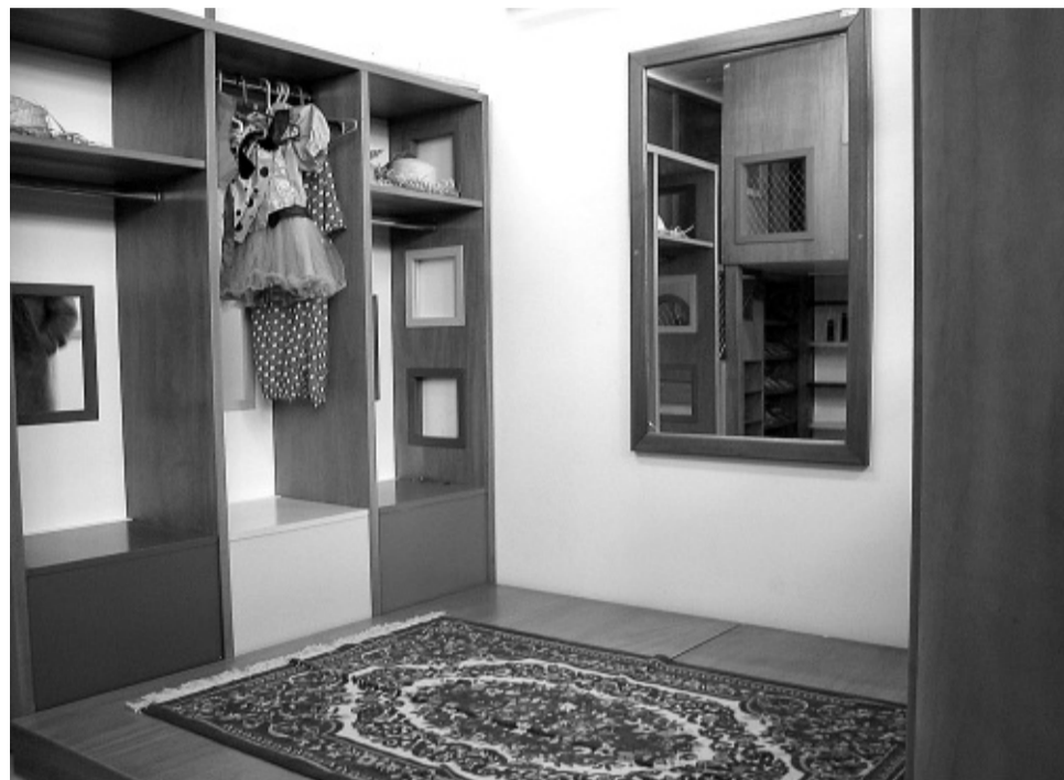
Brinquedoteca da creche Ypê Amarelo projetada pela Arquitetura

totalmente utópico, mas são análises diferentes. O que poderia ser feito era unir o melhor de cada um”, explica a professora. Uma alternativa para as propostas dos acadêmicos saírem do papel seria um trabalho interligado à prefeitura. “Imagino que seja interesse do poder municipal resolver os problemas de invasão,