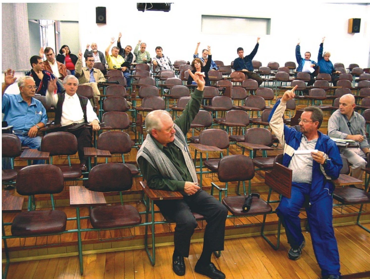
Assembléia do dia 18 de maio na UFSM rejeitou a greve

Não foi apenas na UFSM que os professores desaprovaram a realização de uma greve no mês de junho. Em nível nacional, a reunião do ANDES também descartou a greve agora, no conjunto dos servidores federais. Em relação ao restante do funcionalismo, a perspectiva por enquanto está restrita a algumas categorias. Tanto na UFSM, como em âmbito nacional, os docentes pretendem construir um calendário de mobilizações. Leia mais sobre a política salarial do governo e as possibilidades de greve. Págs. 02, 06 e 07