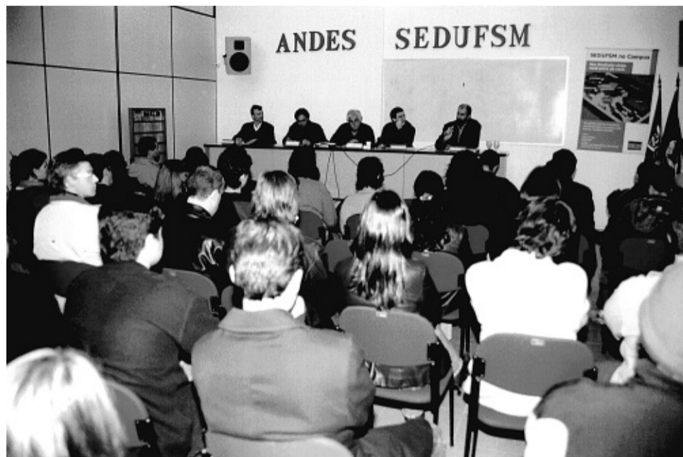
Público assistiu e também participou do debate na SEDUFSM