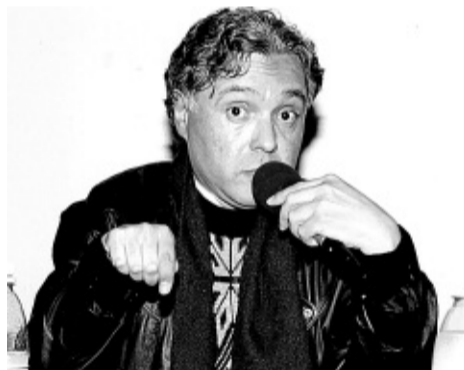
Grohmann: ética do PT era uma bandeira momentânea