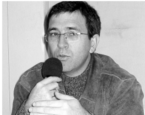
Konrad: revisão das alianças com os conservadores