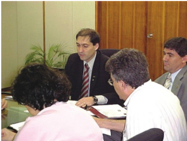
Ministro Fernando Haddad recebe comando dos docentes

por 72 dias, funcionários do Banco Central fizeram a maior greve da história e até defensores públicos cruzaram os braços. “Nesse governo, conseguimos recuperar perdas salariais importantes, mas às custas de greves. Muita coisa poderia ter sido resolvida no diálogo, só que por falta de resposta o jeito foi parar”, reforça David Falcão, presidente do Sindicato Nacional dos Funcionários do Banco Central (Sinal).