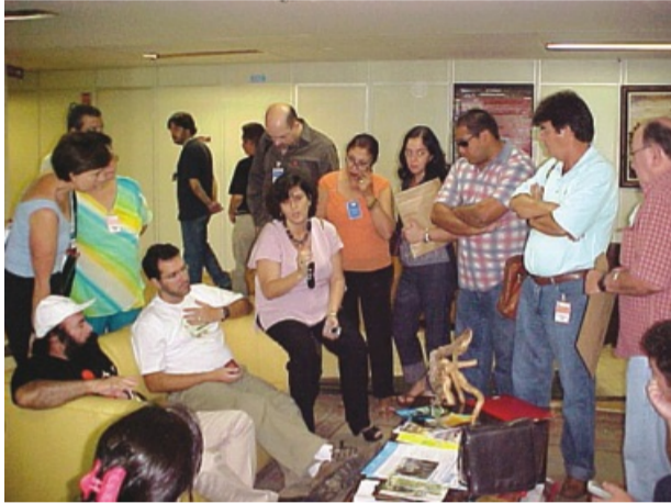
Grevistas esperam para uma das várias audiências no MEC