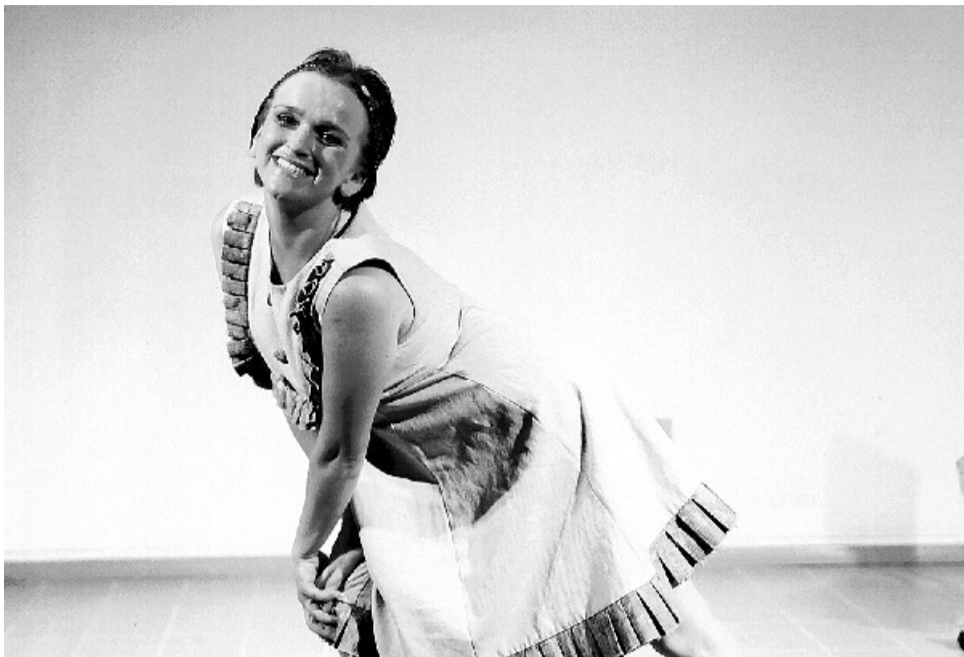
Pose para o clic fotográfico