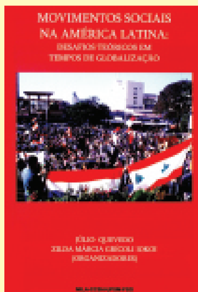
Ilustração da capa do livro "Movimentos Sociais"