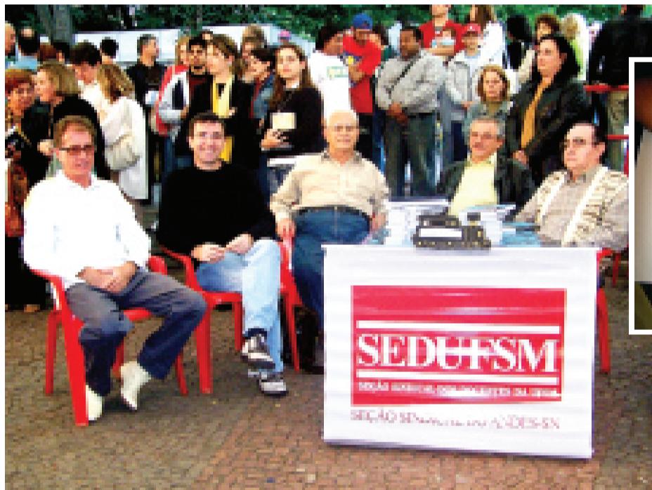
Autores de artigos presentes para autografar "Reflexões"