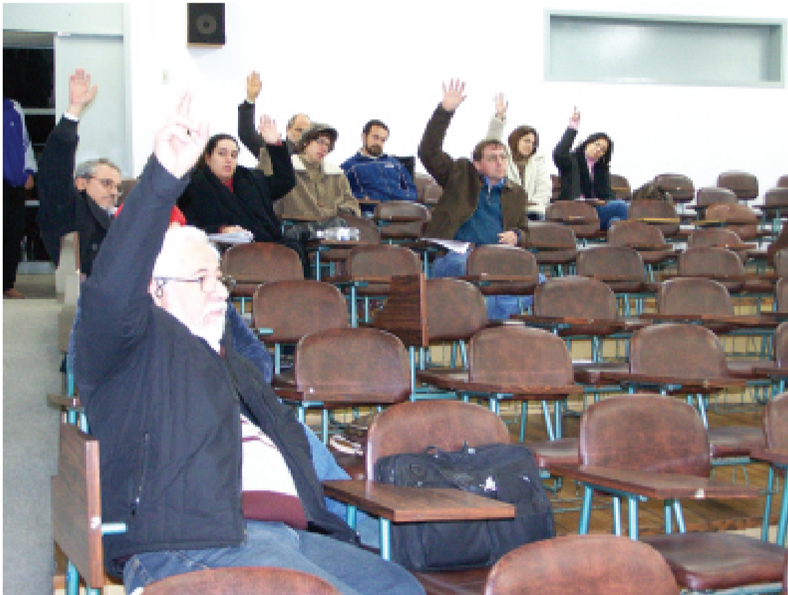
Na UFSM, docentes rejeitam greve pelo fato de a mobilização ser insuficiente

Motivos não estariam faltando para uma greve no entendimento de muitos professores, conforme atestam as discussões em nível nacional, as assembléias convocadas pela SEDUFISM e as opiniões de diversos docentes ouvidos na seção de “opinião” do jornal, nas págs. 06 e 07. Entretanto, o que falta efetivamente é mobilização da categoria. Isso se comprovou em São Luís (MA), às vésperas do 52º CONAD, na reunião do setor das IFES. O indicativo de greve sem data foi rejeitado pela maioria das assembléias de base. Contudo, a posição retirada na reunião nacional de professores das federais é de que só se vai poder construir um movimento paredista se houver mobilização. É essa a prioridade do momento. Acompanhe nas págs. 02, 06 e 07