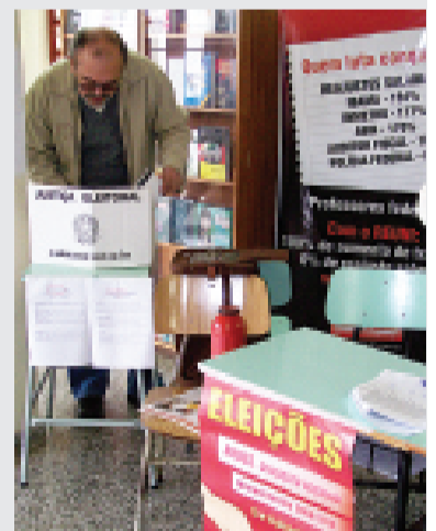
Participação de associados da SEDUFSM foi uma das maiores dos últimos anos

As eleições para a nova diretoria do ANDES-SN foram realizadas nos dias 13 e 14 de maio de 2008, em 87 diferentes instituições de ensino superior do país. A apuração do resultado terminou oficialmente dia 20 de maio de 2008. A nova diretoria tomará posse na plenária de abertura do 53º CONAD, que será realizado em Palmas-TO, entre 26 e 29 de junho de 2008. (Fonte: ANDES-SN)