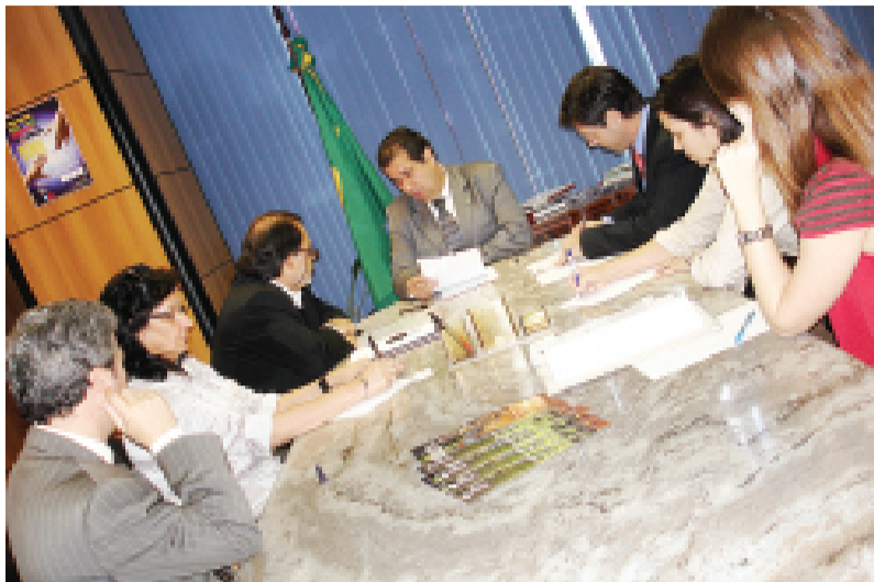
Ministro Carlos Luppi (ao fundo), em reunião com o ANDES, "lavou as mãos" no caso do registro

O Sindicato Nacional dos Servidores Federais da Educação Básica e Profissional - SINASEFE, umas das entidades que manifestam seu apoio, afirmam em nota ao ministro do Trabalho, Carlos Luppi: “a livre organização é um dos princípios que defendemos e não podemos admitir que entidades com lutas históricas em defesa dos trabalhadores