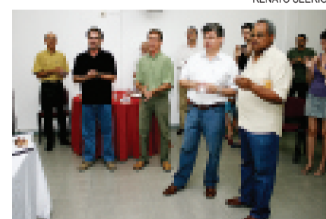
Lançamento de livro, dia 27/11, fechou programação comemorativa

Reflexões dos professores registradas em livro pela terceira vez Extra-classe, pág. 11