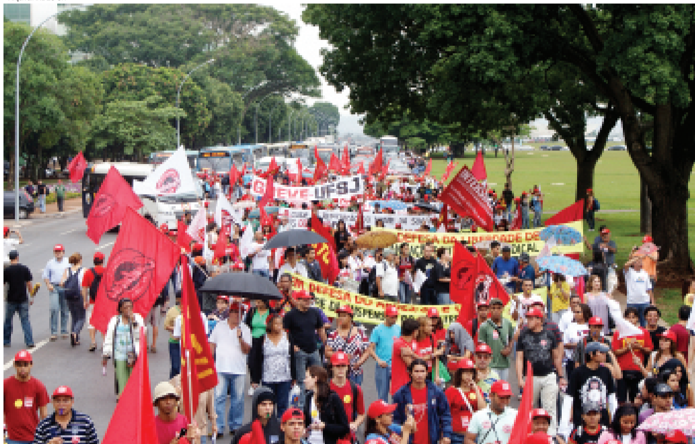
Protesto colorido pelas ruas de Brasília demonstrou a capacidade de mobilização