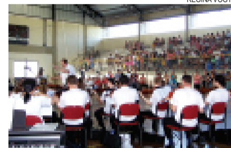
Orquestra sinfônica abriu comemoração de aniversário dia 08/11

Orquestra foi ao bairro Salgado Filho Extra-classe, pág. 10